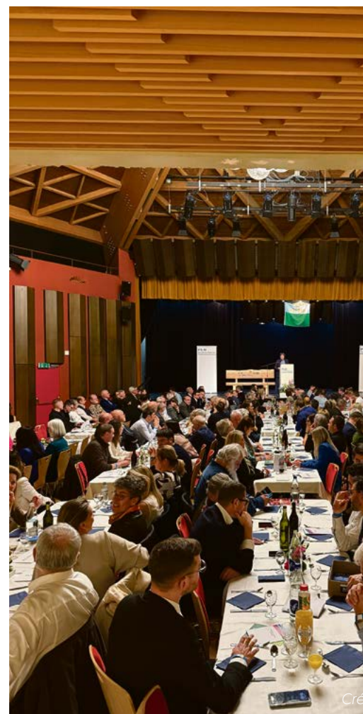
Les membres du PLR étaient présents en nombre lors du soutien du 26 février à Savigny