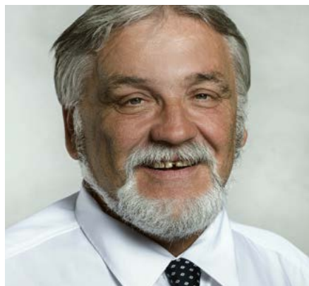
Par Daniel Ruch Conseiller national

La Suisse est confrontée à un défi bien réel: la pénurie de logements. Dans de nombreuses régions, il devient de plus en plus difficile pour les familles, les jeunes ou les seniors de trouver un logement adapté et abordable. Face à cette situation, nous devons explorer toutes les solutions raisonnables, en veillant à préserver notre territoire et nos paysages. C'est précisément l'objectif de la motion que j'ai déposée et que le Conseil national vient d'accepter par 113 voix contre 70.