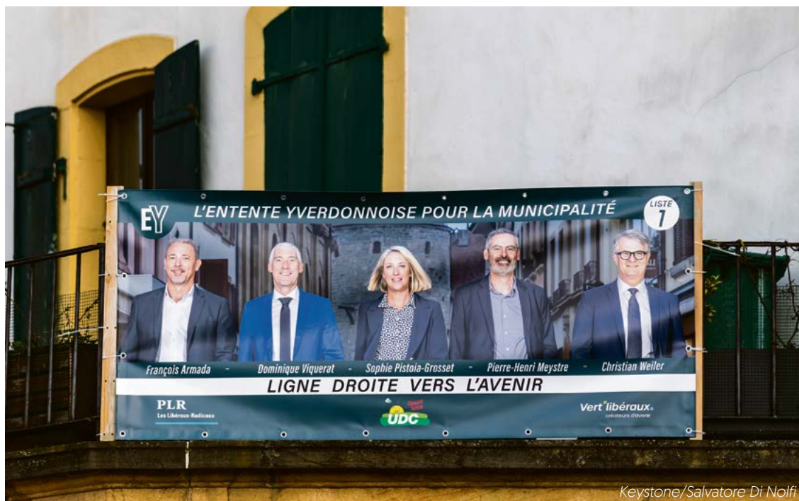
A Yverdon-les-Bains, les cinq candidats de l'Entente à l'exécutif se placent parmi les neuf premiers, le PLR gagne sept sièges au législatif

Deux sièges supplémentaires ont également été enregistrés à Nyon après une erreur de saisie qui a faussé les premiers résultats – deux cents bulletins compacts pour le PLR n'avaient pas été comptabilisés initialement. Ce qui représentait 20'000 voix! Un épisode révélateur de l'importance de chaque bulletin dans des scrutins souvent serrés. Avec désormais 25 élus, les libéraux-radicaux deviennent le premier parti de Nyon où ils pourront se reposer sur une solide présence de la droite et du centre (54 sièges contre 46 pour la gauche). Non loin de là, Gland peut également compter sur un siège supplémentaire pour le PLR, consolidant ainsi sa représentation au sein du conseil communal.