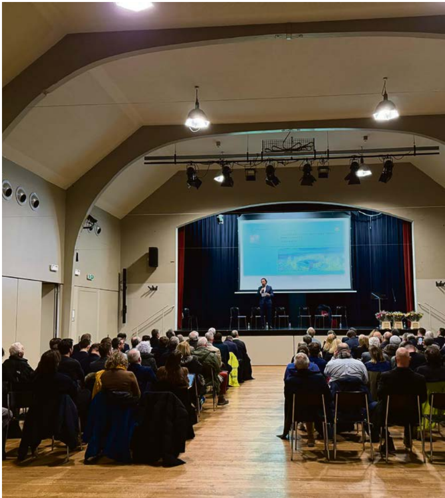
Soirée-débat organisée le 2 février à Bussigny par le PLR de l'Ouest lausannois, en collaboration avec Vaudois!, sur le thème de la mobilité