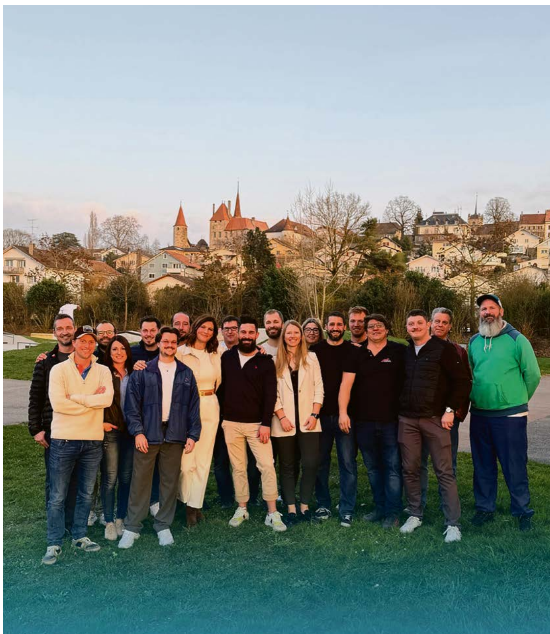
Le PLR Avenches devient la première force politique au Conseil communal avec 20 sièges (+4)

Morceaux choisis, en images, de quelques moments forts de la campagne d'élections. Rendez-vous dimanche 29 mars pour le second tour!