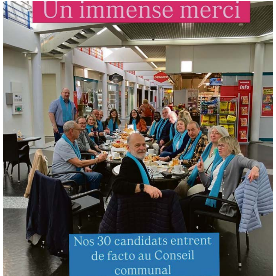
Nos 30 candidats entrent de facto au Conseil communal