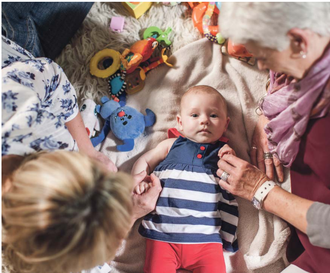
Outre la diminution de la population active, l'initiative entraînerait un renforcement du vieillissement démographique et une baisse indirecte de la natalité