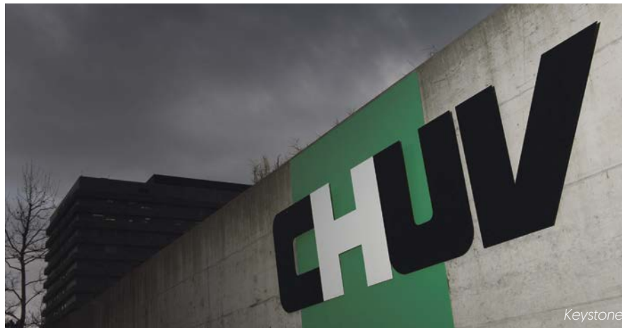
Environ un tiers du personnel des hôpitaux suisse est d'origine étrangère. Au CHUV, cette part s'élève à 43%

elle fragiliserait des équilibres essentiels au bon fonctionnement du pays. Ses conséquences, loin de se limiter à la seule question migratoire, se feraient sentir dans la vie quotidienne, la sécurité, les services publics et la prospérité économique. Plutôt que d'apporter des solutions, elle risquerait ainsi d'aggraver les défis auxquels la Suisse est déjà confrontée.