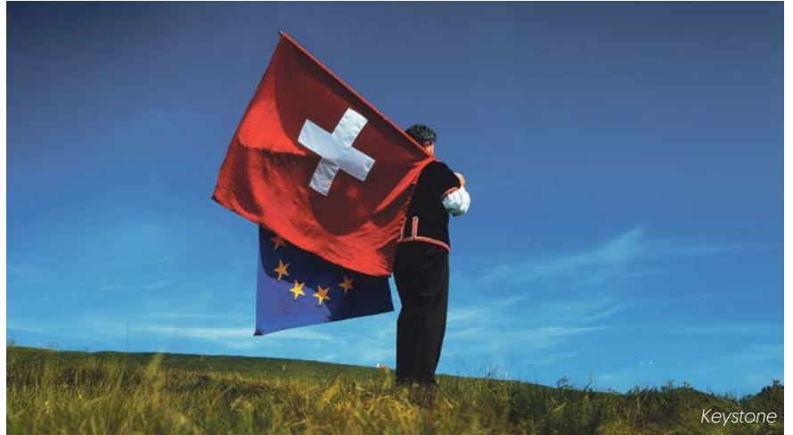
Certains accords internationaux seraient dénoncés, en particulier l'Accord sur la libre circulation des personnes conclu avec l'UE

En provoquant la résiliation de la libre circulation des personnes, l'initiative mettrait en péril l'ensemble des accords des Bilatérales I, qui tomberaient automatiquement dans les six mois en raison de la clause guillotine. Dans le contexte géopolitique actuel et au vu de l'importance du marché européen pour l'économie suisse, les conséquences se-